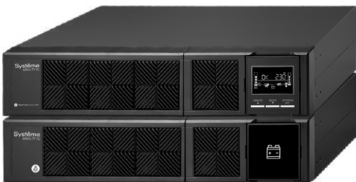
1/2/3 кВА XL*