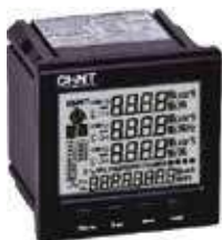
PD7777-S3 Трехфазный цифровой многофункциональный измеритель с ЖК-дисплеем