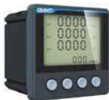
PD666-S3 Трехфазный многофункциональный измеритель с ЖК-дисплеем