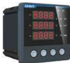
PD666-S4 Трехфазный цифровой многофункциональный измеритель