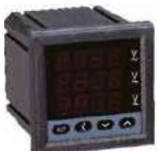
PA/PZ7777-S Трехфазный цифровой амперметр, вольтметр