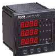
PD7777-S4 Трехфазный цифровой многофункциональный измеритель