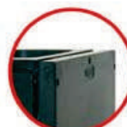
Без дождевой защиты